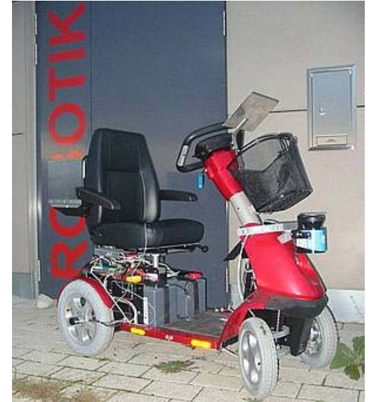
Scooter with driving and navigation assistance - developed at Informatik VII, Univ. of Würzburg, Foto: Lehrstuhl für Informatik VII, Universität Würzburg