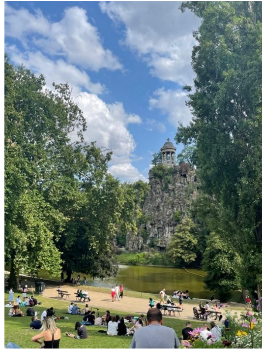
Der Parc des Buttes-Chaumont

Weitere Highlights, die wir dem Leben in der Großstadt verdanken, waren der Besuch der Paralympics gleich zu Beginn unseres Aufenthalts, des großen schwedischen Weihnachtsmarkts und der Fête de la musique , an der man sich vor lauter tanzenden Leuten auf den Straßen kaum noch vorwärtsbewegen konnte.