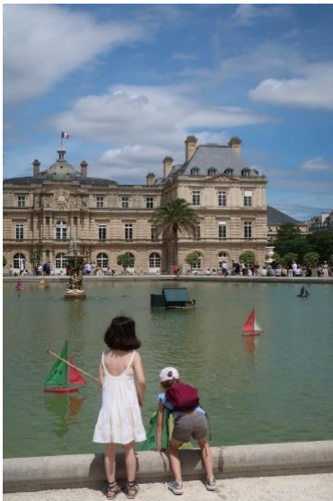
Sommer im Jardin de Luxembourg

Die Jurafakultät der Assas gehört zu den größten und renommiertesten Frankreichs und genießt einen entsprechend elitären Ruf. Neben dem hohen Anspruch in den Lehrveranstaltungen, macht sich dies auch durch verschiedene Aktivitäten, die von der Universität und den unterschiedlichen associations organisiert werden, bemerkbar. Besonders eindrücklich war für uns eine Veranstaltung im Februar, bei der die Anwälte, die im Fall um Gisèle und Dominique Pelicot tätig waren, ihre erste öffentliche Konferenz seit Abschluss des Prozesses im Dezember 2024 hielten. Sie fand im größten, für 1500 Menschen ausgelegten und randvoll gefüllten Hörsaal der Assas statt und bot sehr spannende Einblicke in die juristische Aufarbeitung des Falls.