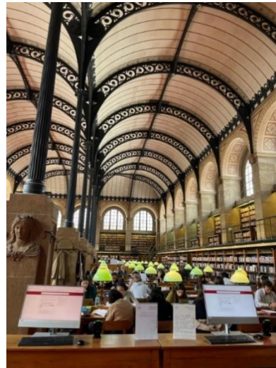
Bibliothèque Saint Geneviève

Gut wurden, verschlug es uns meistens in die Bibliotheken der unmittelbaren Umgebung, deren eindrucksvolle Architektur eine besonders einladende Lernatmosphäre schafft. Von dort war man in 15 Minuten an der Notre Dame für einen Spaziergang an der Seine oder in 5 Minuten in der Rue Mouffetard für Crêpes zu Studentenpreisen.