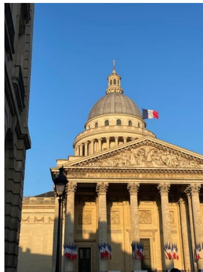
Das Panthéon, Wahrzeichen des Quartier Latin und Grabstätte berühmter französischer Persönlichkeiten, darunter Marie Curie und Victor Hugo.

Zusätzlich zu den Abgaben wird nach ein paar Wochen im Semester eine interrogation , d.h. eine schriftliche und benotete Abfrage durchgeführt. In der Hälfte des Semesters findet der galop d'essai , eine Art Zwischenprüfung statt, bei der in Vorbereitung auf die Abschlussprüfung eine dreistündige Klausur geschrieben wird. Anders als der Name es vermuten lässt, handelt es sich dabei nicht um einen lockeren Probedurchlauf, sondern auch hierfür gibt es eine Note, die am Ende einen nicht geringen Teil der Endnote für den Kurs ausmacht.